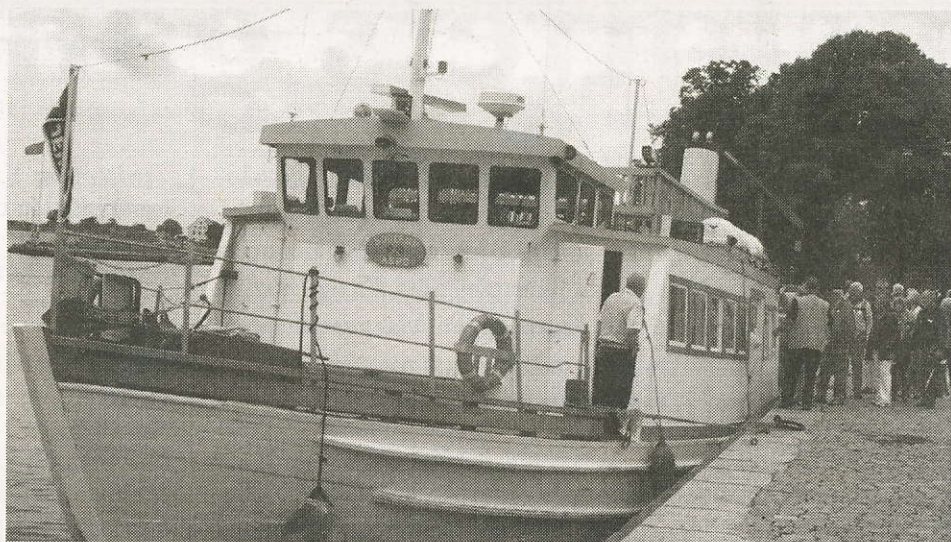
Embarkering vid Kungsbron.

Hans sätt att ge "insides information" fånglade verkligen medlemmarna i föreningen. Felmanövrering eller inte är fortfarande en öppen