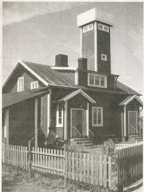
Lotsstationen på Långören.