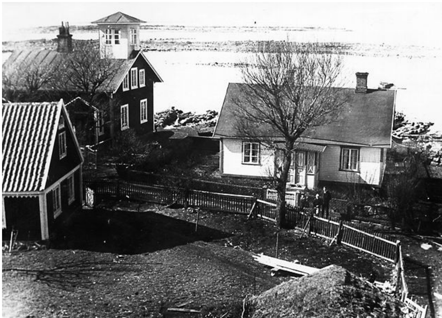
Foto taget 1922 på Långören där vi ser lotshuset, mästerlots Per Berglunds hus och änkefru Karolina Larssons hus som senare blivit ombyggt. Foto Ernst Berglund 1922