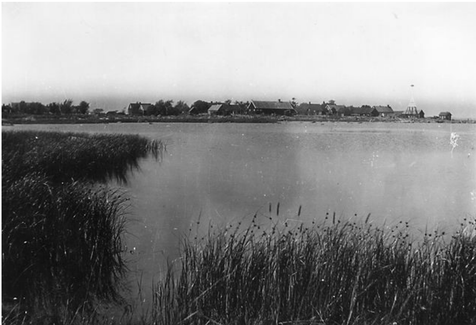
Foto taget från sydost på byn på Långören på ön med samma namn, utanför Torhamn i Karlskrona skärgård. Foto Ernst Berglund 1922